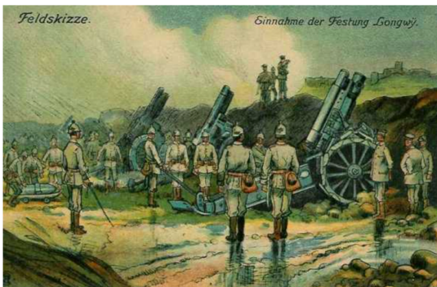
Mortiers allemands devant Longwy