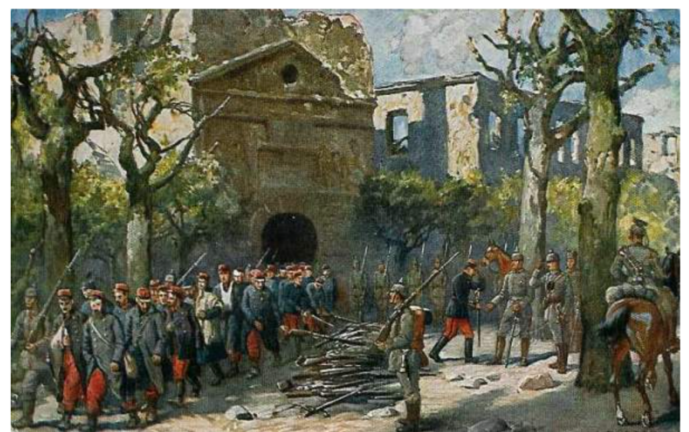
Reddition de Longwy Collection privée